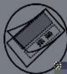
当护卡膜大小不合适时(图A)